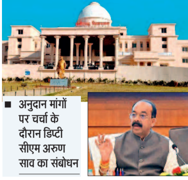
अनुदान मांगों पर चर्चा के दौरान डिप्टी सीएम अरुण साव का संबोधन

उप मुख्यमंत्री साव ने बताया कि जल जीवन मिशन के कार्यों को पूरा करने के लिए राज्य के बजट से पूरा सहयोग मिल रहा है। कार्यों का कड़ाई से मूल्यांकन करते हुए पारदर्शिता के साथ निर्माण एजेंसियों को मुगतान किया जा रहा है। पिछले ढाई वर्षों में 5077 टंकियां बनाई गई हैं, गांव के सभी घरों में जल से पानी पहुंचने वाले 5028 से अधिक गांवों को हर घर जल प्रमाणित कराया गया है।