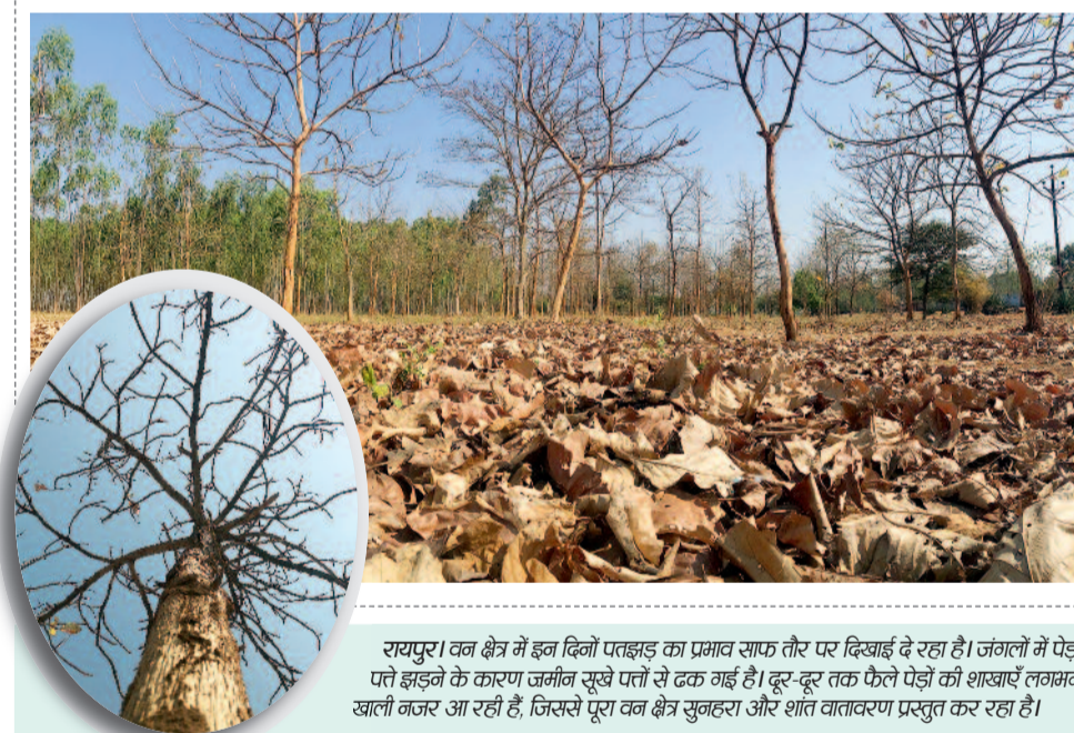
रायपुर। वन क्षेत्र में इन दिनों पतझड़ का प्रभाव साफ तौर पर दिखाई दे रहा है। जंगलों में पेड़ों से पत्ते झड़ने के कारण जमीन सूखे पत्तों से ढक गई है। दूर-दूर तक फैले पेड़ों की शाखाएं लगभग खाली नजर आ रही हैं, जिससे पूरा वन क्षेत्र सुनहरा और शांत वातावरण प्रस्तुत कर रहा है।